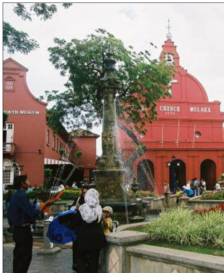
Jeden z křesťanských kostelů v Malajsii v Melace